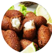
KIBES RECHEADOS ACOMPANHAMENTO DE COALHADA E HORTELÃ