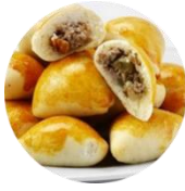
ESFÍNDAS DE CARNE

*Estes além de passados também ficam em bandejinhas nas mesinhas