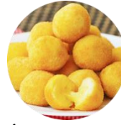
PÉROLAS DE QUEIJO